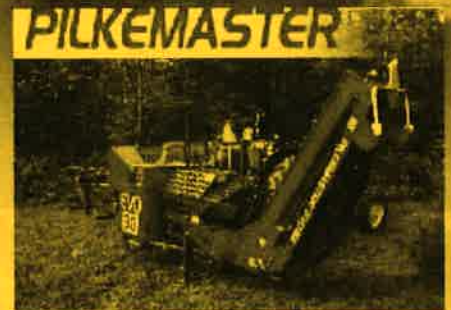
PROCESSEUR À BOIS