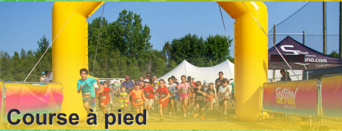
Course à pied