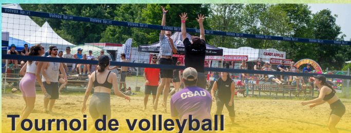
Tournoi de volleyball