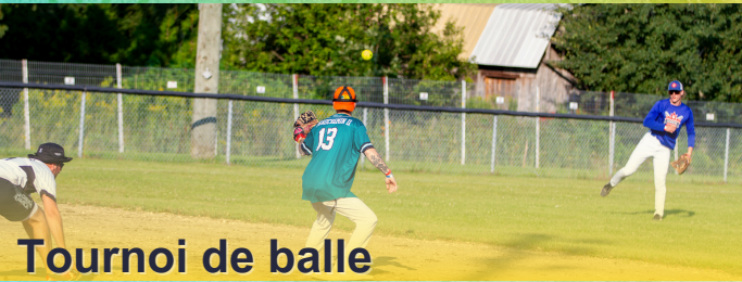
Tournoi de balle