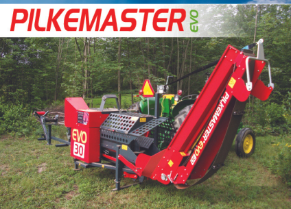
PROCESSEUR À BOIS

11 480, boul. du Parc-Industriel, Bécancour (Ste-Gertrude) G9H 3P3 gestionjoanmarcel2@hotmail.com